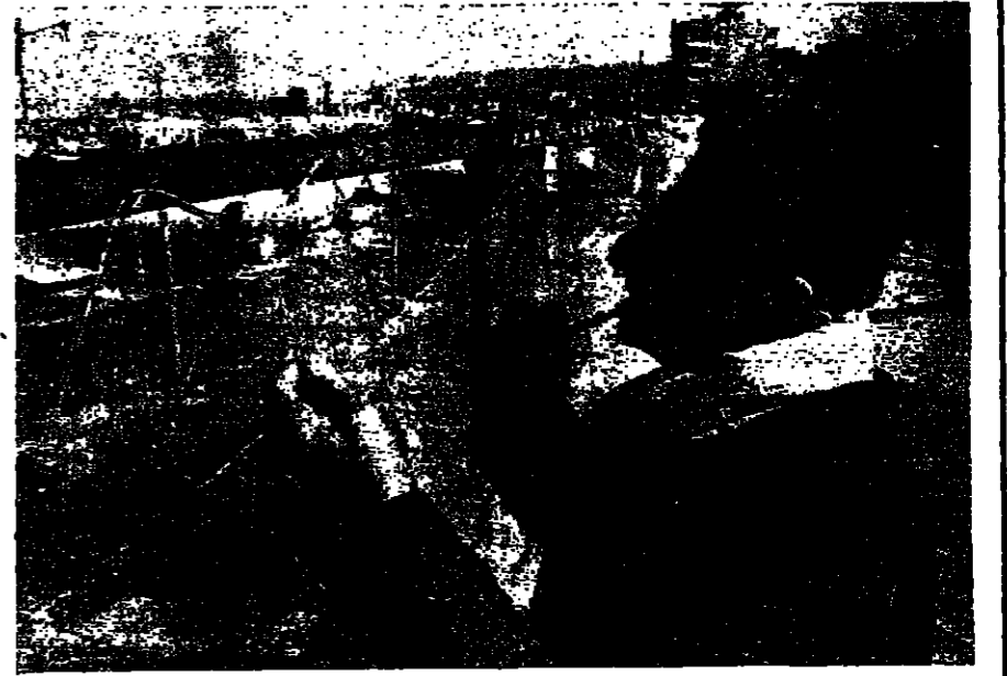
تهيلة الشباك للمصيد